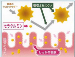
仮説に基づく腸管吸収イメージ